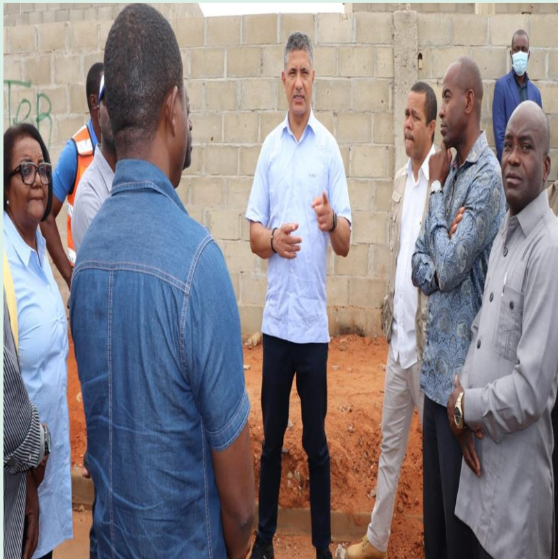
Foto: Ministro da Energia e Águas, João Baptista Borges, proferiu algumas considerações.

O Ministro da Energia e Águas, João Baptista Borges efectuou uma visita de constatação, na manhã de sexta-feira, 23 de Setembro de 2022, a alguns empreendimentos do sector das águas na cidade capital, Luanda.