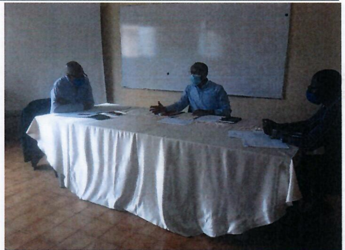
Momentos da reunião entre o CFHH e o IRSEA