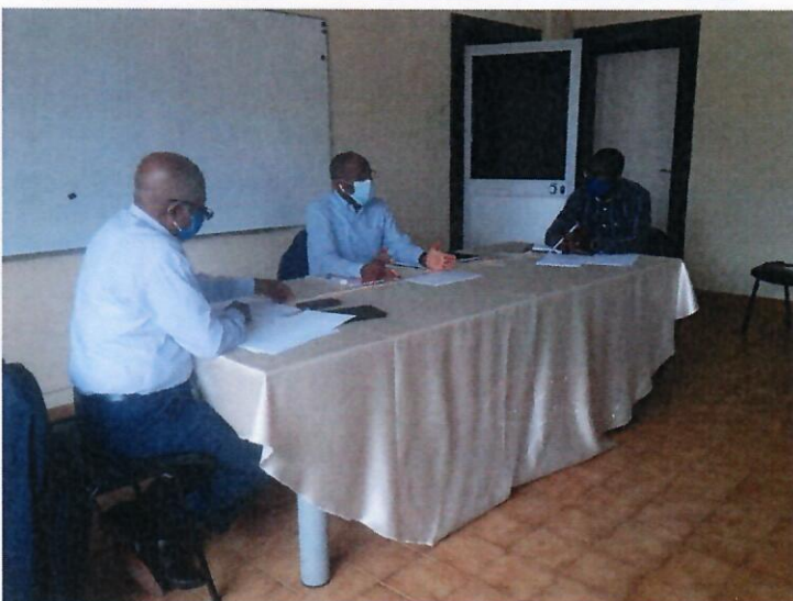
Momentos da reunião entre o CFHH e o IRSEA