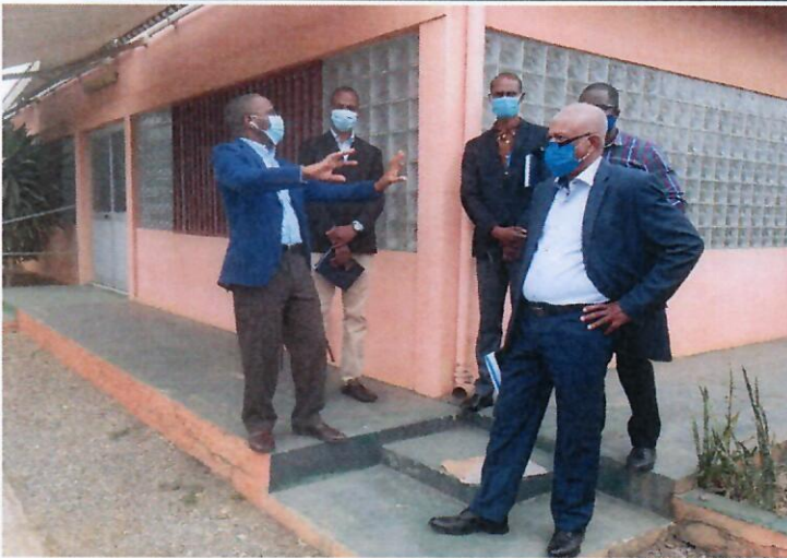
Visita guiada às instalações