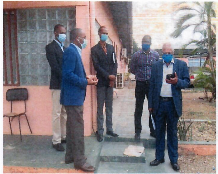
Visita guiada às Instalações